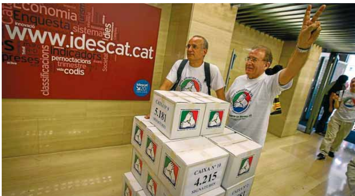
Els promotors de la ILP per a la renda de ciutadania van entregar les signatures a l'Idescat el 25 d'octubre

Càritas Diocesana de Barcelona haurà atès aquest any 64.000 persones, mentre que el 2010 en va atendre 56.789. El 44% viuen de lloguer, el 21% en habitacions rellogades i el 7% han estat acollides gratuïtament per familiars o amics. Pel que fa a ajuts, l'entitat de l'Església fa un esforç per garantir l'habitatge. Amb un pressupost de 5,3 milions en ajudes, dos milions han estat per pagar lloguers, aigua, llum o gas. ■