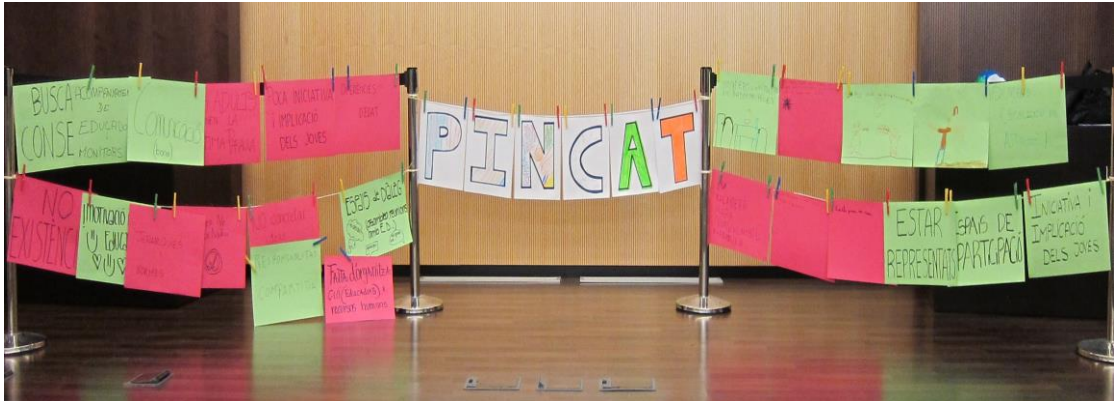
Imatge extreta de la Primera Trobada, PINCAT 2015