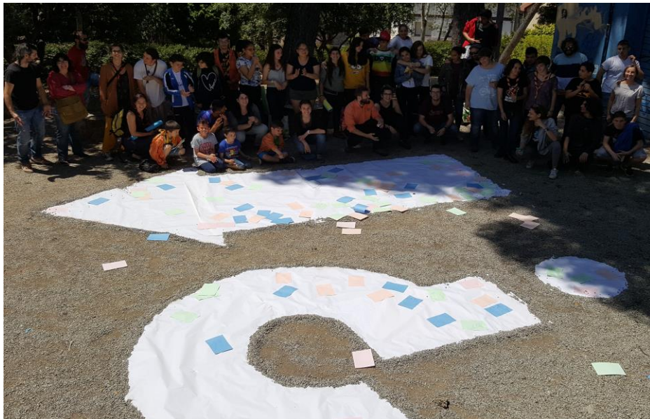
Imatge extreta de la Segona Trobada, PINCAT 2017