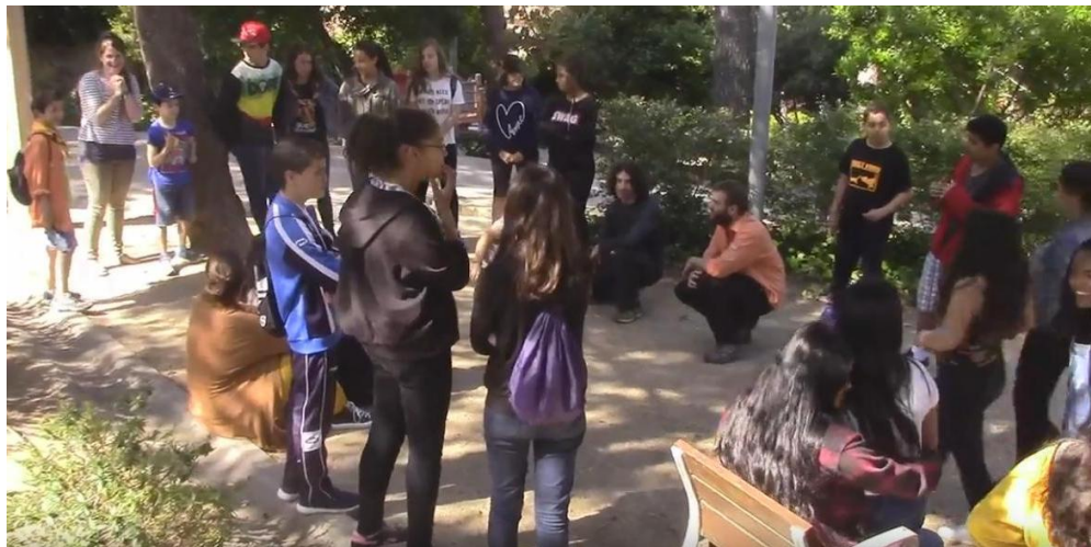
Imatge extreta de la Segona Trobada, PINCAT 2016

Els infants de l'Esplai Espurnes van preparar una dinàmica per recordar la importància de la participació. La idea d'aquesta activitat era recordar als presents la importància que té que els infants participin.