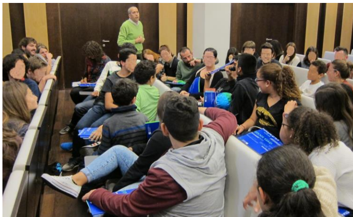
Imatge extreta de la Primera Trobada, PINCAT 2017

Es va fer una dinàmica amb una pilota de colors que representava a la PINCAT. Es va llençar la pilota perquè algun assistent a l'acte l'agafés. Cada cop que un infant o jove agafava la pilota havia de fer una breu valoració de la trobada i expressar la voluntat de continuar el treball encaminat cap a una segona trobada.