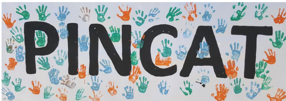
Imatge extreta de la Segona Trobada, PINCAT 2017

Abans de marxar es va convidar a tots/es els/les participants a posar les mans a un mural que s'havia penjat a una de les parets del parc amb l'acrònim "PINCAT". Calia omplir de color el cartell amb la finalitat de recordar que totes les entitats participants formen la Plataforma d'Infància de Catalunya.