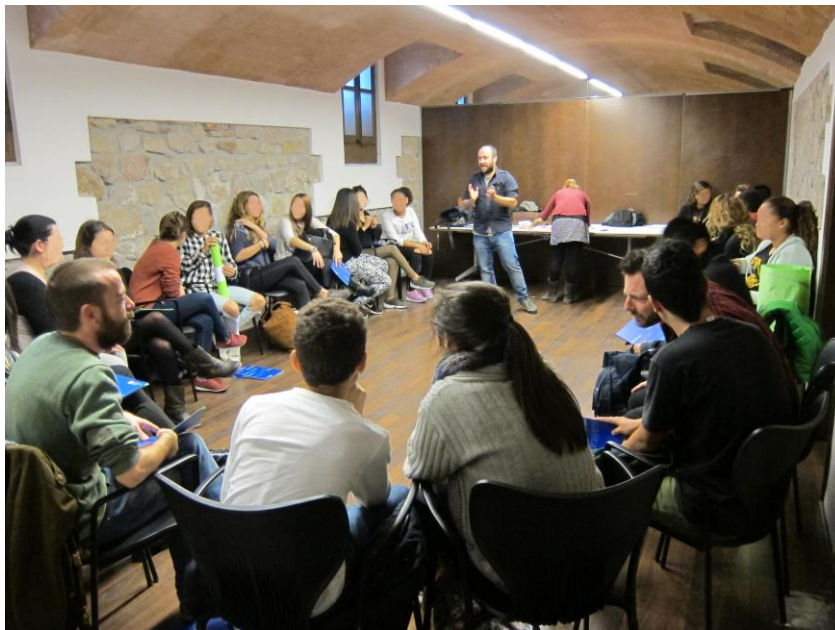
Imatge extreta de la Primera Trobada, PINCAT 2015