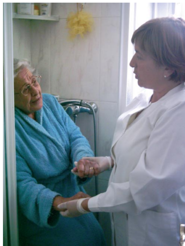
Una de les principals prioritats de la Taula en el 2008 fou el seguiment del procés de desplegament de les noves lleis socials

Després de la seva important contribució als debats i al procés d'aprovació d'aquestes noves lleis l'any 2007, en el 2008 la Taula va donar seguiment al seu procés de desplegament per mitjà de la participació en òrgans consultius i en reunions específiques amb el Departament d'Acció Social i Ciutadania de la Generalitat. També va dur a terme trobades i tallers interns amb les seves entitats sòcies per definir el seu posicionament, particularment durant el procés d'elaboració i aprovació de la primera Cartera de Serveis Socials 2008-2010 . L'aplicació de la Llei d'autonomia personal i atenció a la dependència va patir endarreriments i entrebancs d'ordre organitzatiu i financer que van contrastar amb l'expectativa que havia generat la seva aprovació. La Taula, que es va fer ressò d'aquesta situació, va plantejar la necessitat de reforçar els dispositius tecnològics i organitzatius, així com la necessitat de redimensionar el finançament de la llei i la major implicació de l'Administració General de l'Estat i la seva coordinació amb la Generalitat.