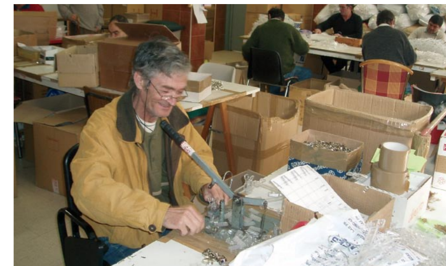
La crisi econòmica iniciada al 2008 va fer més necessàries que mai les polítiques d'inclusió social i el treball de les entitats socials

En l'àmbit local, la Taula va analitzar els plans locals d'inclusió en procés d'elaboració a 20 municipis catalans, i va impulsar la participació i la implicació de les entitats del tercer sector presents en aquests municipis.