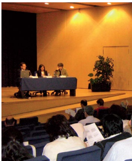
El 6 de juny de 2008 la Taula va organitzar una jornada, a l'auditori de l'ONCE, per debatre l'impacte sobre el tercer sector de la nova Llei de contractes del sector públic.