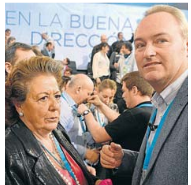
El president valencià, Alberto Fabra, amb l'alcalde de València, Rita Barberá.

Els titulars dels serveis són els que hauran de recaptar els diners i