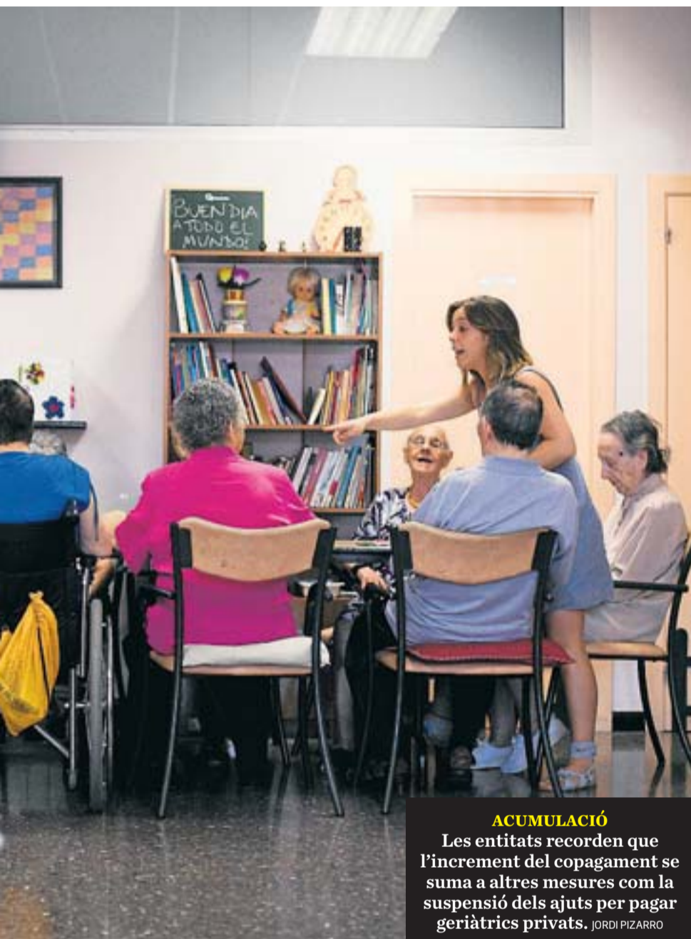
ACUMULACIÓ Les entitats recorden que l'increment del copagament se suma a altres mesures com la suspensió dels ajuts per pagar geriàtrics privats. JORDI PIZARRO

des durant l'elaboració, i volen que es tracti en la pròxima reunió del Consell General de Serveis Socials.