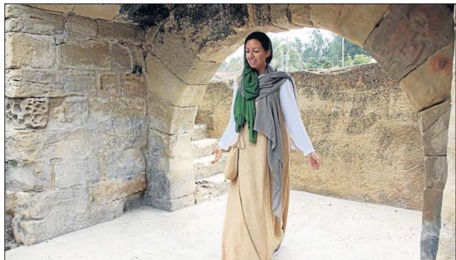
NUEVA RUTA TURÍSTICA SEFARDÍ EN TORTOSA. De la mano de un personaje de ficción, Blanca (en la imagen) ya se puede conocer el barrio judío de Tortosa a partir de las nuevas visitas guiadas La jueva de Tortosa . Se organizan una vez al mes.

El president de FESOCA assegura que se senten «satisfets de que les persones sordes puguin ser ateses en igualtat de condicions». En futures fases d'aplicació, l'app podria ampliar-se als turistes que no dominin alguna de les cinc llengües dels operadors del 112 a Catalunya (castellà, català, anglès, francès i alemany), com el turisme emergent rus o xinès.