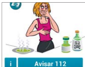
Un dels pictogrames de l'app. 112

Aquest escull la imatge que descriu el seu problema (cremades, marejos, mal de pit...) i la trameta a la central de trucades 112, que recull la localització de l'usuari i d'altres dades rellevants, com l'historial mèdic i la medicació o les persones de contacte. L'app s'ha creat amb l'assessorament tècnic de Telefónica i amb la col·laboració de l'associació de persones sordes FESOCA, que presideix Antonio Martínez Álvarez. Va dirigida a les més de 27.000 perso-