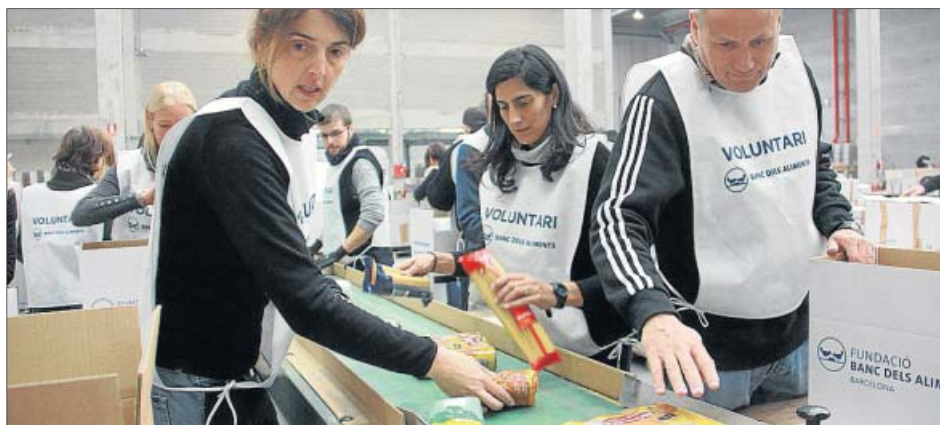
Voluntarios del Banc dels Aliments recogiendo comida este fin de semana.

20.000 voluntarios han trabajado para reunir esta cantidad de comida a la que habrá que sumar las aportaciones realizadas por diferentes empresas. El 2012 se recogieron 2.700 toneladas, que fueron a parar a más de 250.000 personas sin recursos del territorio mediante 170 entidades sociales que reciben productos del Banc dels Aliments.