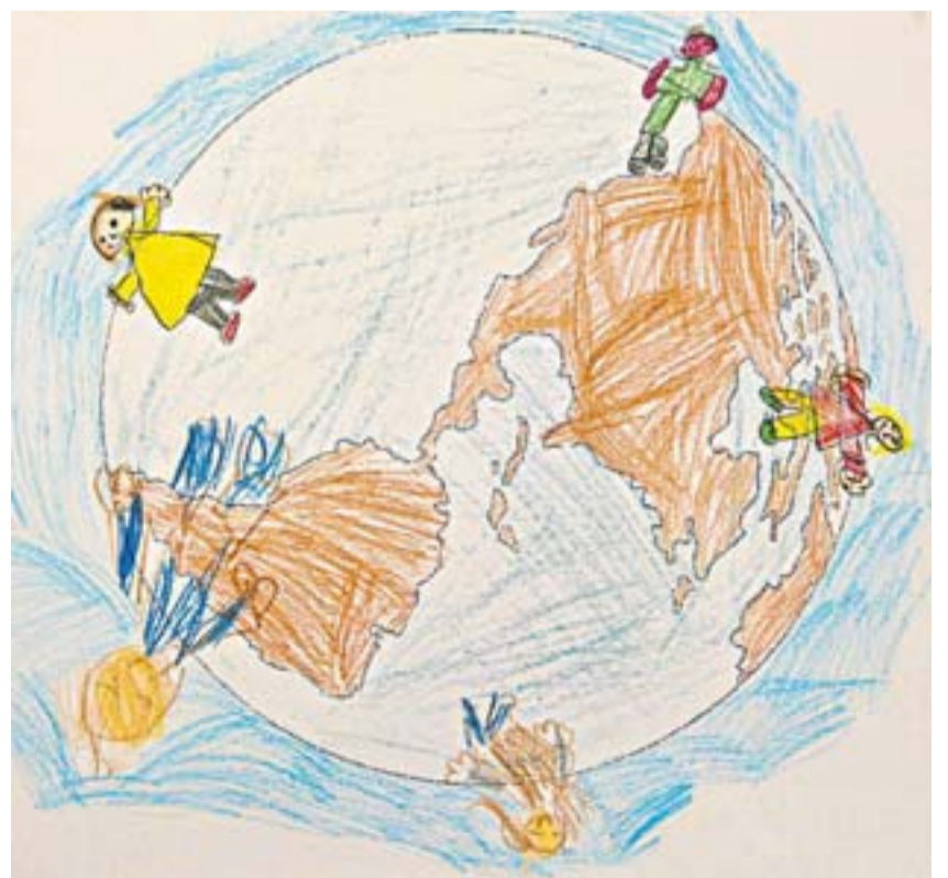
VINYET, 6 ANYS / CLARA, 6 ANYS

L'Unicef també considera prioritària la feina en emergències com el tifó de les Filipines, que ha afectat 4,6 milions de criatures, entre les quals n'hi ha 217.800 de desplaçades. "El tifó va malmetre l'accés a l'aigua potable i al sanejament, cosa que pot fer que es propaguin molt ràpidament malalties que poden arribar a ser mortals", recorda Todó. L'Unicef treballa en aquest àmbit, en l'accés a l'alimentació, distribueix kits d'higiene i es fa càrrec de nens que han quedat separat de les famílies, entre altres actuacions. Ja hi ha destinat 1,3 milions de dòlars, però calcula que en necessitarà 34,3 milions. Todó afegeix que a Síria hi ha més d'un milió de nens desplaçats: "Tampoc els podem oblidar".