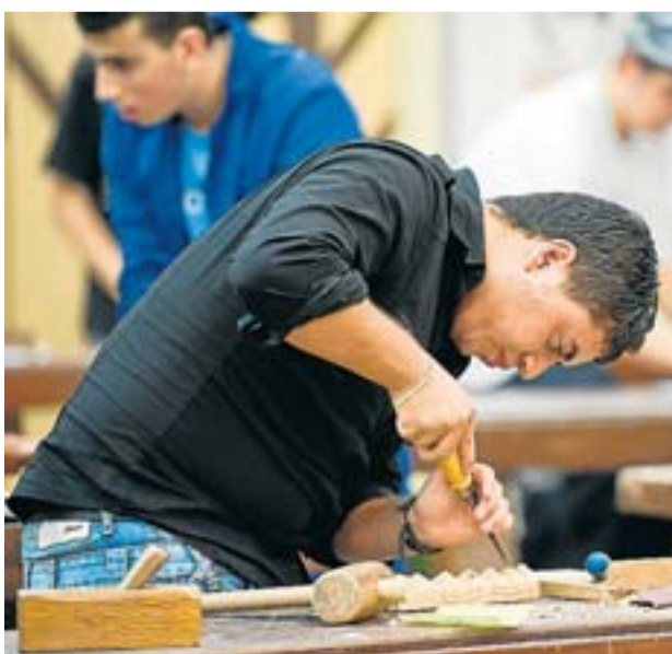
La Fundació Bofill demana augmentar les places de FP, tant de grau mitjà com superior.

"problemes d'equitat" a l'hora d'aconseguir graduar-se en els estudis superiors. Unes diferències, però, que tenen menys a veure amb l'origen social de la família i molt més amb el nivell d'estudis dels pares. La màxima desigualtat es produeix en les enginyeries, on un alumne amb pares que tenen estudis superiors (sigui quina sigui la seva ocupació i estatus social a la pràctica) té quasi 15 vegades més probabilitats de graduar-se que els fills de pares sense estudis. En el cas de les ciències, aquestes diferències són de 9 a 1 i en carreres d'empresa o dret són del 8,6. Per això, Palacín va reclamar a les administracions "un esforç per augmentar les places i l'accessibilitat a la FP superior especialment, i també les beques universitàries" per contrarestar aquestes desigualtats.